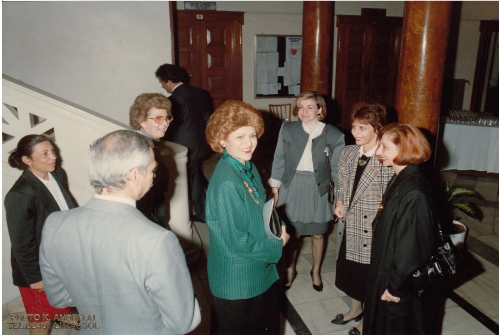
Άφιξη στο Δημαρχείο της Πρώτης Κυρίας της Κυπριακής Δημοκρατίας, Ανδρούλας Βασιλείου, 4/12/1988