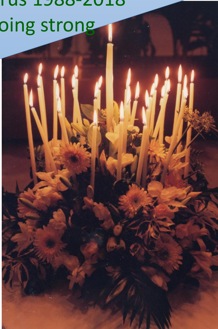
Annual Candle lighting ceremony