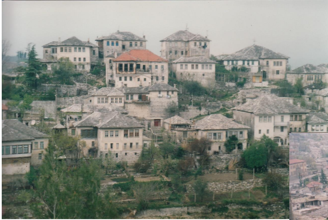
Απόψεις από το Αργυρόκαστρο Views of Gjirokastra