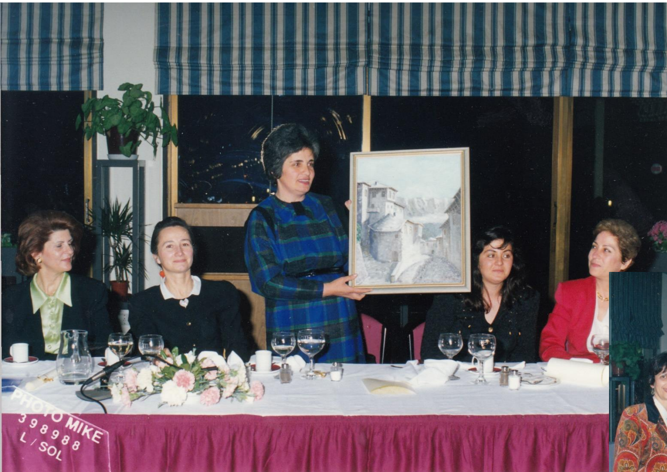
Return visit by Girokaster to Limassol Candle lighting με BPW Αλβανίας, 1995